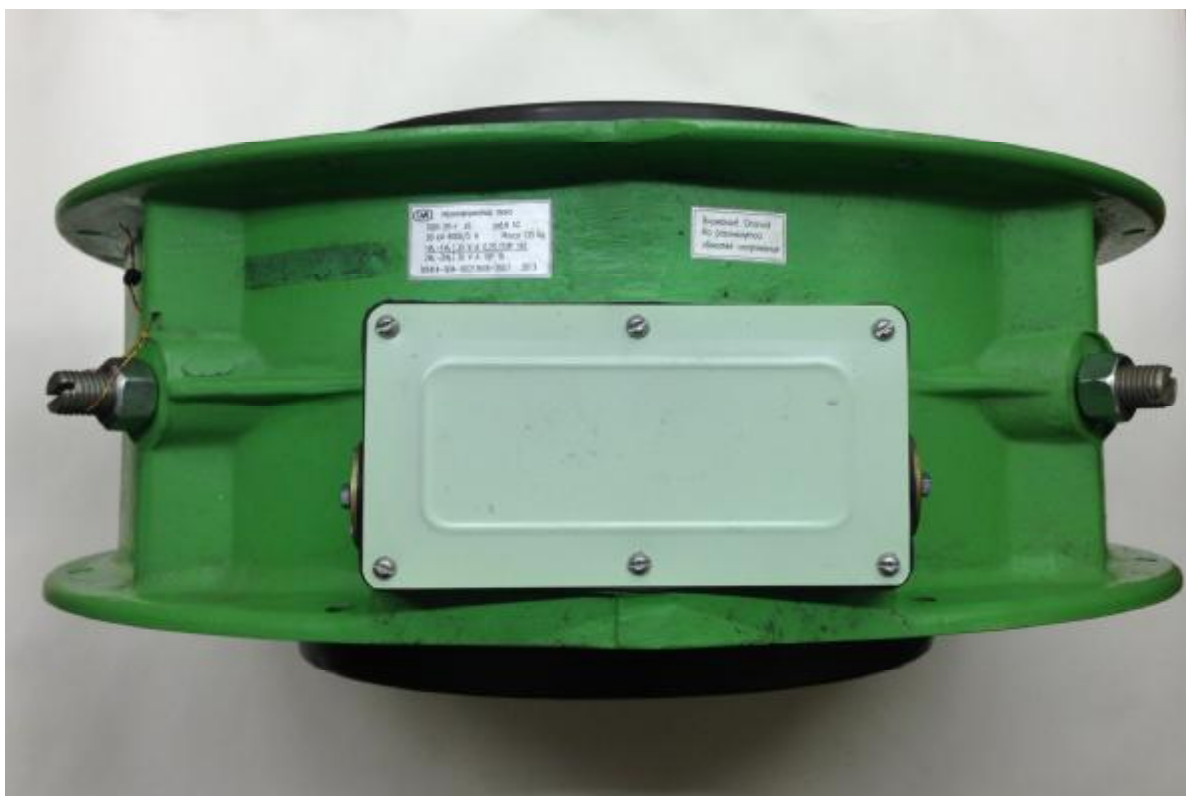
Рисунок 2 – Трансформатор ТШЛ-20, вид сверху