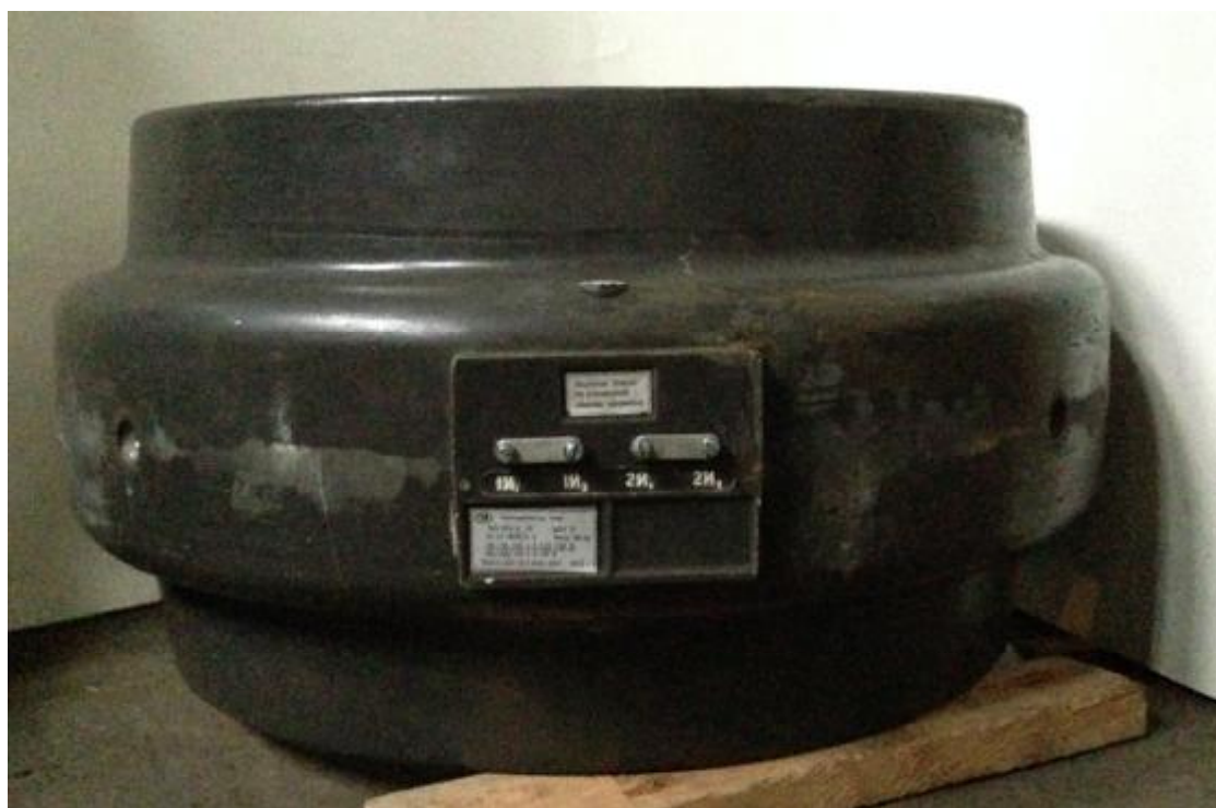
Рисунок 3 – Трансформатор ТШЛ-20 без корпуса (ТШЛ-20Б)