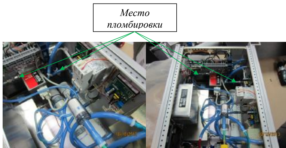
Рисунок 2 – Схема пломбирования расходомера-пробоотборника.

На рисунке 2 приведены схема пломбирования и обозначение мест для нанесения пломб в целях предотвращения несанкционированной настройки и вмешательства.