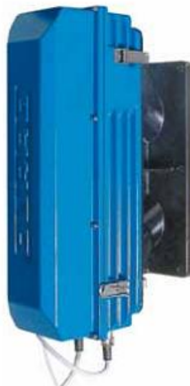
Рис.3. Внешний вид анализатора пыли D-R 300-40. Блок измерений.

Анализаторы пыли D-R 300-40 состоят из трех блоков: блока измерений, блока обдува и блока управления (рис. 3).