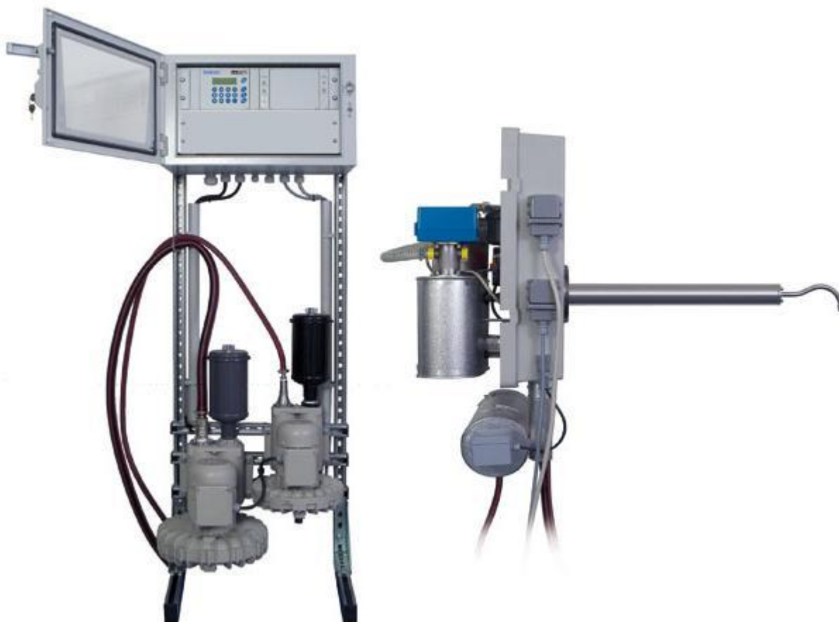
Рис.5. Внешний вид анализатора пыли D-R 820F. Блок управления и блок обдува (слева), блок измерений (справа).

Блок измерений модели D-R 800 предназначен как для создания и регистрации светового потока, так и для управления работой прибора, индикации результатов измерений и осуществления операции ввода/вывода.