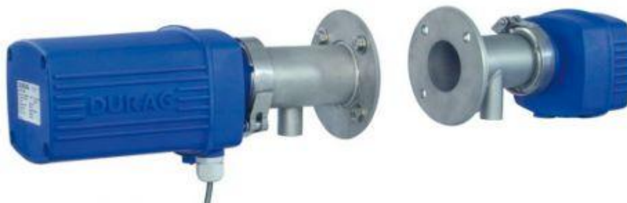
Рис.1. Внешний вид анализатора пыли D-R 220. Блок измерений (слева), отражатель (справа).

Конструктивно прибор состоит из трех блоков: блока измерений, отражателя, блока обдува (рис. 1).