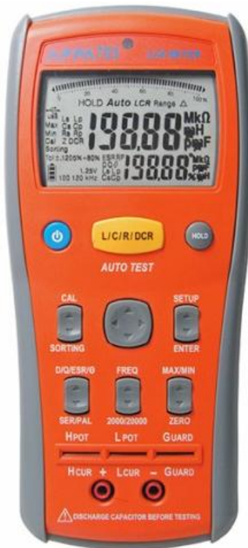
Рис. 1. Фотография общего вида измерителей LCR.

Фотография общего вида измерителей LCR представлена на рис. 1. Схема пломбировки от несанкционированного доступа изображена на рисунке 2.