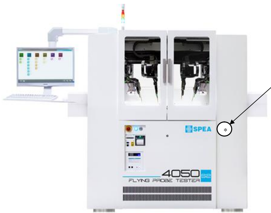
Система SPEA 4050 IBL. * - место наклейки.