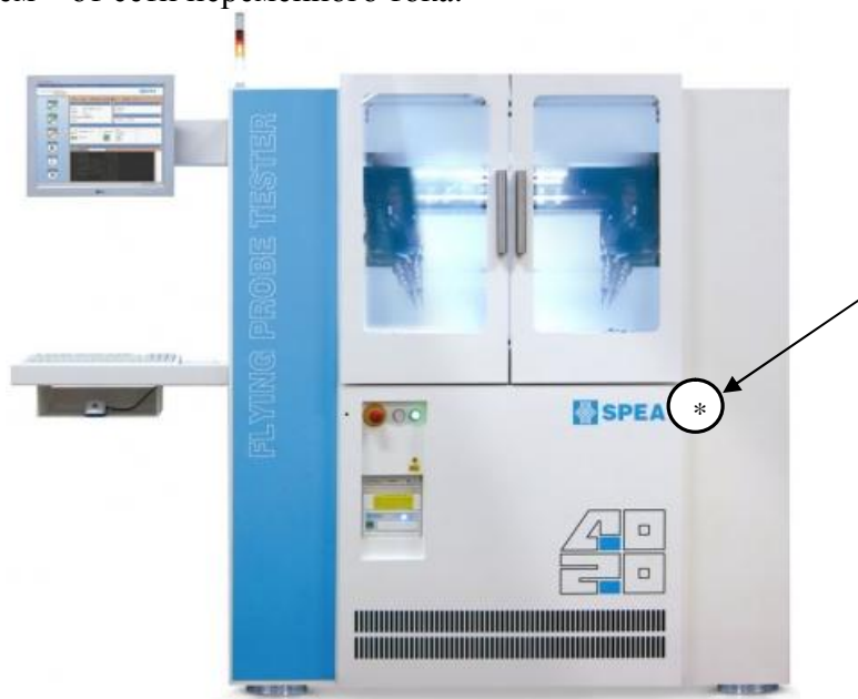
Система SPEA 4020.

Питание систем – от сети переменного тока.