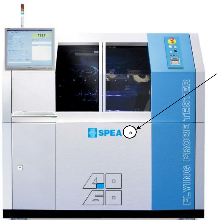
Система SPEA 4060 FBL. * - место наклейки.