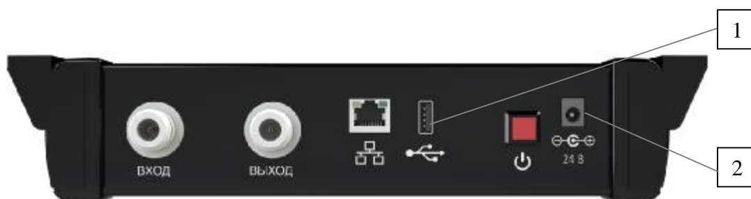
Рисунок 1 – Внешний вид анализаторов. Вид спереди