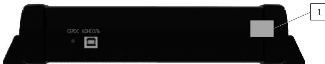
Рисунок 2 – Внешний вид анализаторов. Панель верхняя