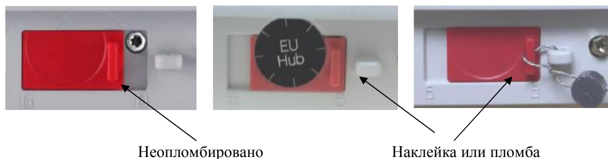
Рис. 3 Схема пломбировки от несанкционированного доступа

Схема пломбировки весов от несанкционированного доступа приведена на рис. 3.