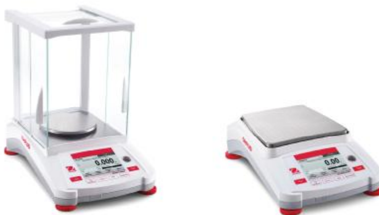
Рис. 1 Общий вид весов Adventurer

Принцип действия весов основан на компенсации массы взвешиваемого груза электромагнитной силой, создаваемой системой автоматического уравновешивания. Электрический сигнал, изменяющийся пропорционально массе взвешиваемого груза, преобразуется в цифровой сигнал. Результаты взвешивания выводятся на ЖК дисплей.