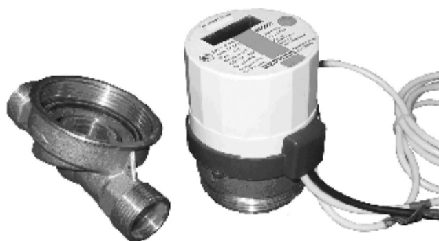
Рис 1 Внешний вид