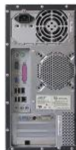
Рисунок 2 – Схема пломбировки от несанкционированного доступа MB110 (слева) ПК (справа)