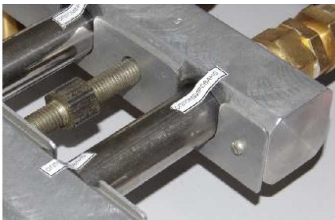
Рисунок 2 – Место пломбирования эталонных микросопел

Набор эталонных микросопел критических используются в качестве средств задания расхода в установке, работающие в критическом режиме – скорость потока в горловине сопла равна критической скорости, а ниже горловины может превосходить ее. Постоянство расхода через поверяемое средство измерения и микросопла обеспечивается тем, что его величина определяется давлением и температурой атмосферного воздуха, забираемого из помещения, в котором эксплуатируется установка и не зависит от давления вниз по потоку.