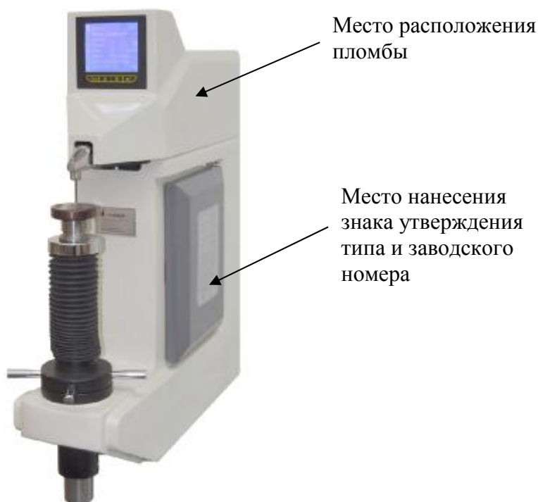
Рисунок 1 – Внешний вид твердомеров

Внешний вид твердомеров с указанием мест нанесения знака утверждения типа и пломбирования приведён на рисунке 1.