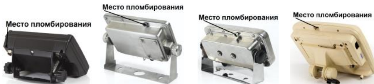
Рисунок 4. Место пломбирования терминала весов (индексы T1, T2, T3 и T4 соответственно)

–пломбирочная чашка устанавливается на задней крышке корпуса терминала весов (в соответствии с Рисунком 3).