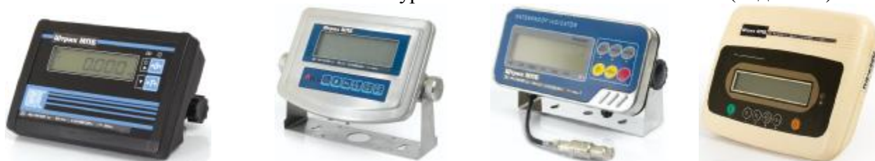
Рисунок 2. Исполнения терминалов (индексы Т1, Т2, Т3, Т4 соответственно).

Терминал (Рисунок 2) выпускается в четырех исполнениях: - с дисплеем массы и двумя кнопками клавиатуры (индекс Т1), с дисплеем массы и шестью кнопками клавиатуры (индекс Т2), с дисплеем массы и шестью кнопками клавиатуры водонепроницаемого исполнения (индекс Т3) и с дисплеем массы и шестью кнопками клавиатуры в пластмассовом исполнении (индекс Т4).