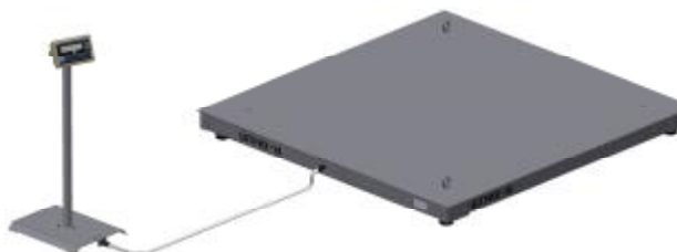
Рисунок 1. Общий вид весов электронных Штрих МПБ

Весы (Рисунок 1) состоят из весоизмерительного устройства, включающего в себя четыре весоизмерительных тензорезисторных датчика типа S (регистрационный № 57673-14, изготовитель фирма "Keli SENSING TECHNOLOGY (Ningbo) Co., Ltd.", Китай), грузоприемного устройства (далее – ГПУ) и весового терминала (далее – терминал), установленного на выносной стойке и связанного с весоизмерительным устройством посредством кабеля.