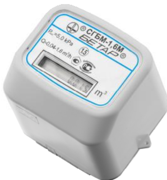
Рисунок 1 – Общий вид счетчика газа

Исполнение счетчиков газа с температурной коррекцией приводит измеренный объем газа к стандартным условиям (к температуре T=20\text{ }^{\circ}\text{C} ).