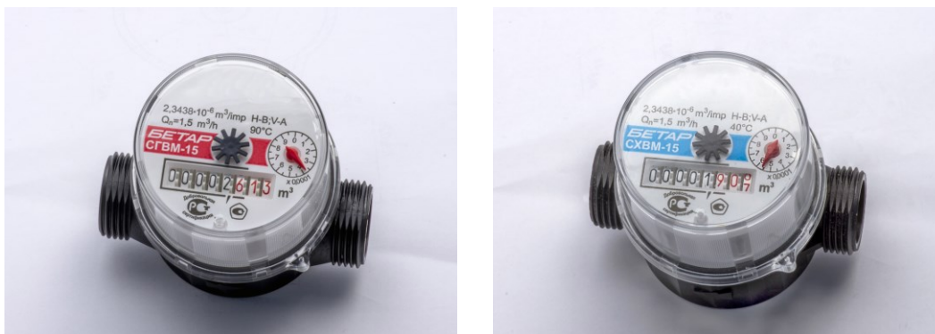
Рисунок 2 – Общий вид счетчиков (материал корпуса – пластик)

Пломбирование счетчиков осуществляется с помощью защитного кожуха на защелках, который соединяет корпус и счетный механизм. Знак поверки наносится на наклейку, установленную на внешнюю боковую сторону счетчика защитного кожуха на защелках. Схема пломбировки от несанкционированного доступа, обозначение места нанесения знака поверки счетчиков представлено на рисунке 3.