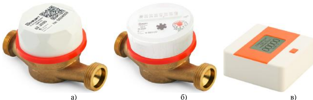
а) – Счетчик СВД; б) – Счетчик СВУ; в) – Выносной индикатор Рисунок 1 – Общий вид счетчиков