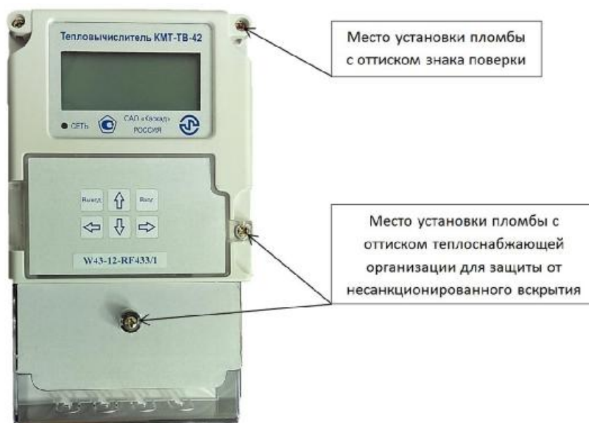
Рисунок 3 – Общий вид тепловычислителя модификации КМТ-ТВ-42-W43