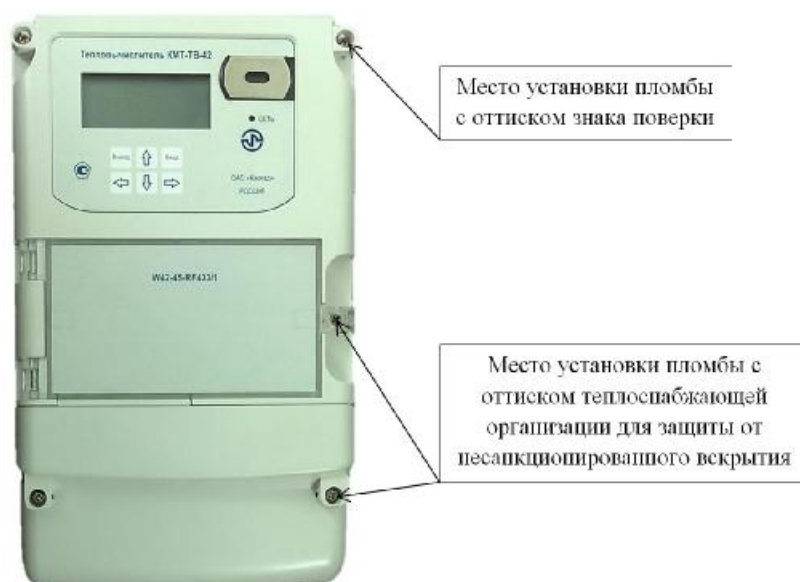
Рисунок 2 – Общий вид тепловычислителя модификации КМТ-ТВ-42-W42