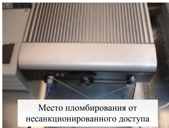
Рисунок 4 – Промышленный компьютер