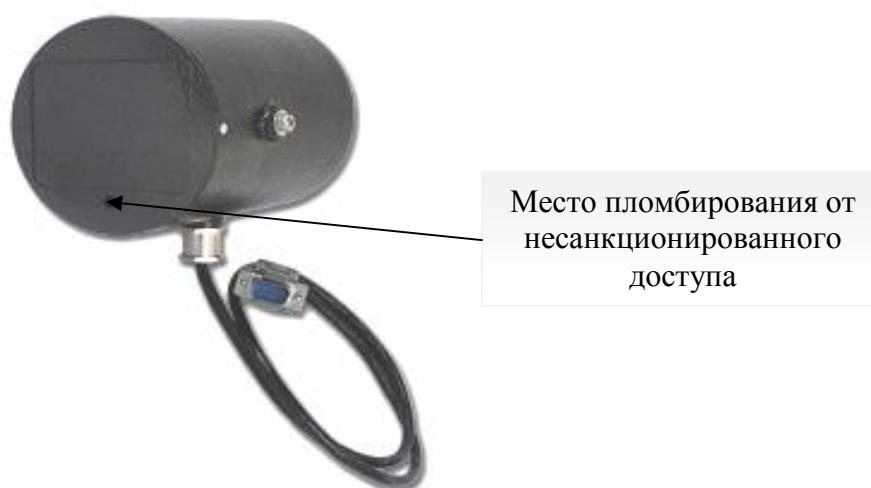
Рисунок 1 – Измеритель скорости DR500S

Внешний вид составных частей комплекса, обозначение места для размещения знака утверждения типа и мест пломбирования от несанкционированного доступа представлены на рисунках 1-4.