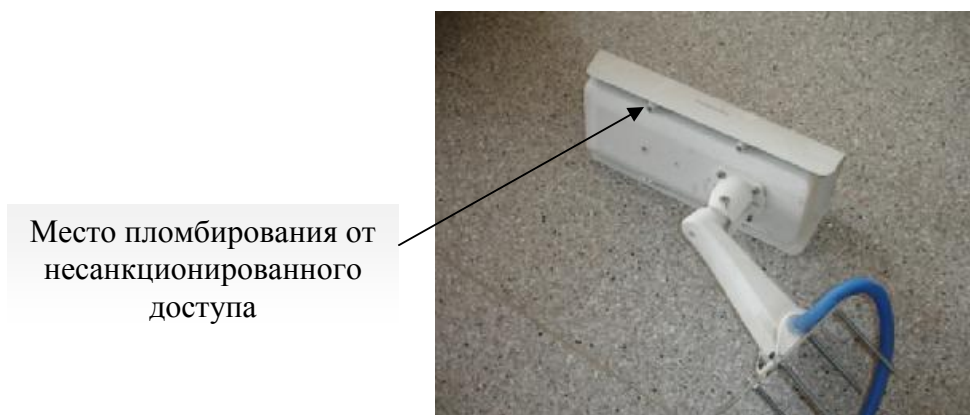
Рисунок 2 – Камера Автокам в сборе с термокожухом и кронштейном