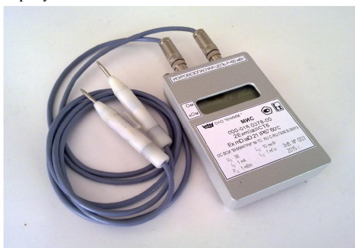
Рисунок 1 - Общий вид измерителя сопротивлений МИС исполнения 000-018.0378-00

Внешний вид измерителей исполнения 000-018.0378-00 и исполнения 000-018.0378-00-01 представлены на рисунке 1 и рисунке 2. Место установки поверительного клейма указано на рисунке 3