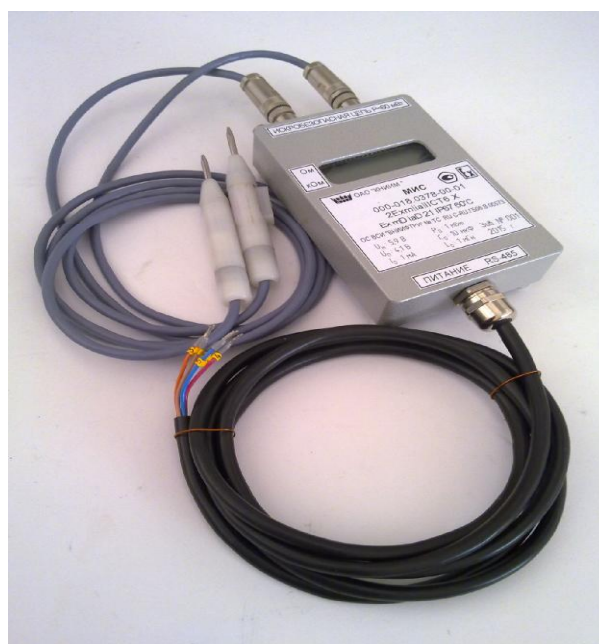
Рисунок 2 - Общий вид измерителя сопротивлений МИС исполнения 000-018.0378-00-01