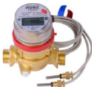
Рисунок 1 – Общий вид теплосчетчиков