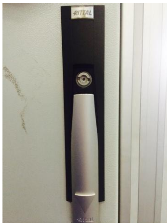
Рисунок 4 – Замок на боковой дверце распределительного шкафа