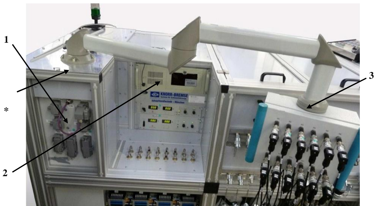
Рисунок 3 – Вид на составные части рамы. 1 – распределительный шкаф, 2 – промышленный компьютер, 3 – консоль с датчиками * - место для нанесения знака поверки