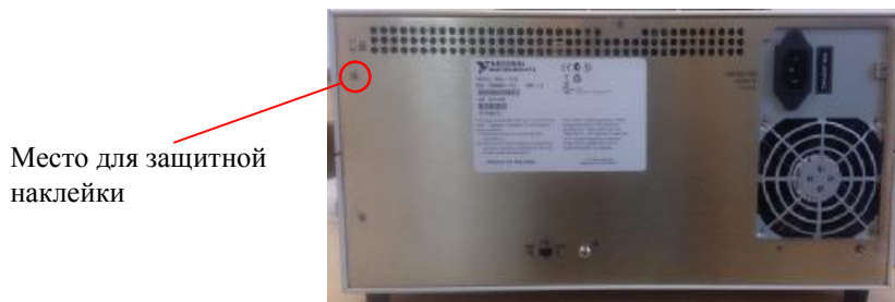
Рисунок 2 — Место для защитной наклейки

Защита от несанкционированного доступа предусмотрена в виде защитной наклейки на задней панели шасси PXIe-1078.