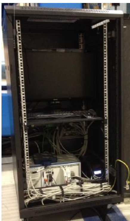
Рисунок 1 – Шкаф приборный

Внешний вид шкафа приборного и рабочего места оператора приведен на рисунках 1 и 2, соответственно.