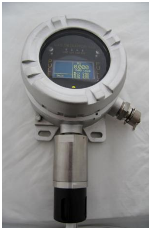
Рисунок 1 – Внешний вид газоанализатора ССС-903МЕ (HNO 3 ) (исполнение с УПЭС-903МЕ из нержавеющей стали)

Внешний вид газоанализаторов приведен на рисунках 1, 2 и 3, места пломбировки корпуса газоанализатора от несанкционированного доступа и рекомендуемые места нанесения знака поверки - на рисунке 3 (знак поверки наносится в том случае, если условия эксплуатации обеспечивают сохранность знака в течение всего интервала между поверками).