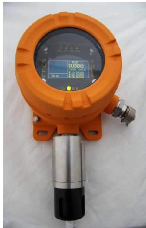
Рисунок 2 – Внешний вид газоанализатора ССС-903МЕ (HNO 3 ) (исполнение с УПЭС-903МЕ из алюминиевых сплавов)