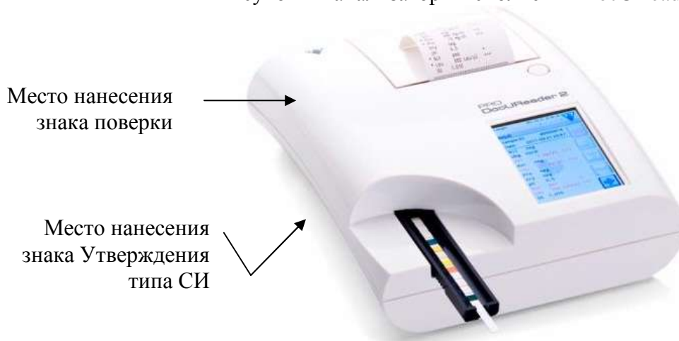
Рисунок 2 - анализаторы исполнений DocUReader 2 и DocUReader 2 Pro