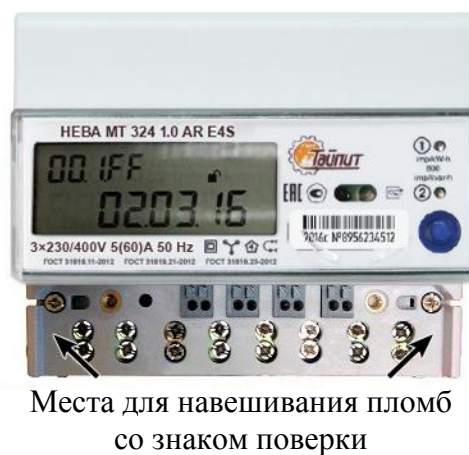
Рисунок 2 - Счетчик НЕВА МТ 324

Конструкция счетчиков НЕВА МТ 314 и НЕВА МТ 315 идентична счетчику НЕВА МТ 313. Конструкция счетчика НЕВА МТ 323 идентична конструкции счетчика НЕВА МТ 324.