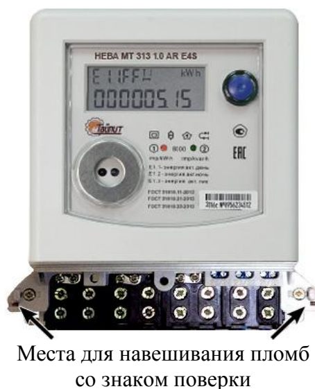
Рисунок 1 - Счетчик НЕВА МТ 313