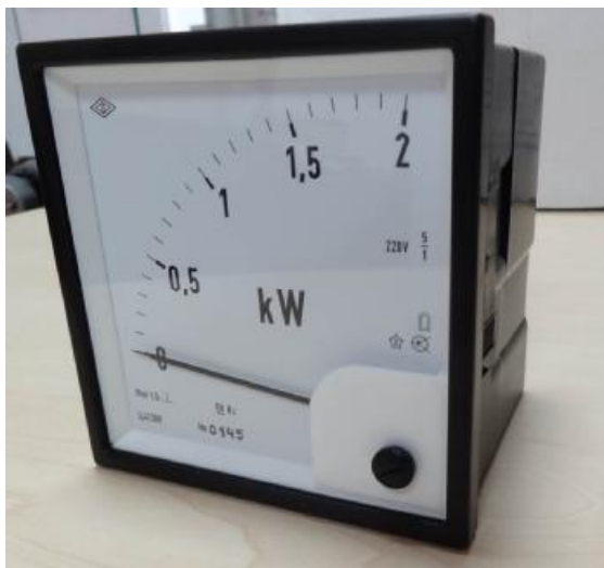
Рисунок 1 - ваттметры и варметры Ц42308

Фотографии, общий вид приборов, места нанесения маркировки и клейм показаны на рисунках 1 - 2.