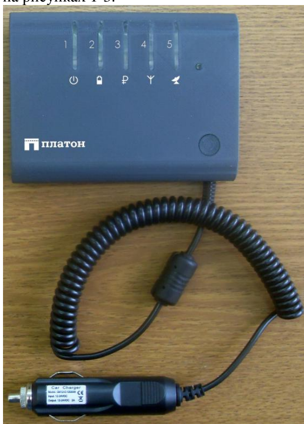
Рисунок 1 - Общий вид устройства

Внешний вид устройства с указанием мест нанесения знака утверждения типа и пломбирования приведен на рисунках 1-3.