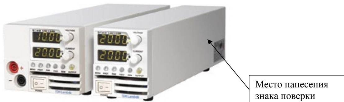
Рисунок 1- Внешний вид источников питания постоянного тока программируемых серии Z+

Схема пломбировки источников от несанкционированного доступа приведена на рисунке 2.