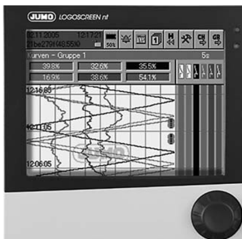
Рисунок 2 - Внешний вид регистраторов «LOGOSCREEN nt» тип 706581