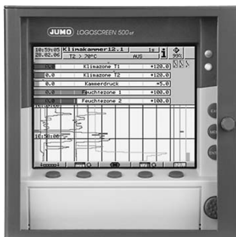
Рисунок 3 - Внешний вид регистраторов «LOGOSCREEN 500 cf» тип 706510