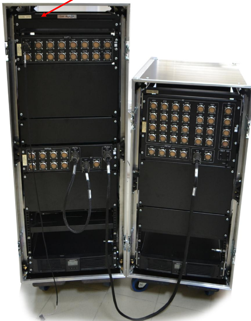
Рисунок 1 - Общий вид системы ИЦАД-Л