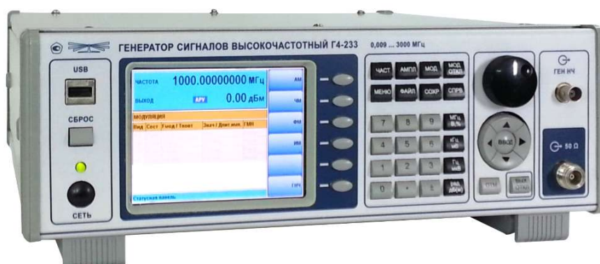
Рисунок 1 - Внешний вид генератора

Внешний вид генератора приведен на рисунке 1.