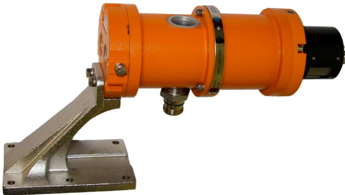
Рисунок 3 - Газоанализатор СГОЭС-М - внешний вид с кронштейном и модулем отображения информации и встроенным HART - разъемом