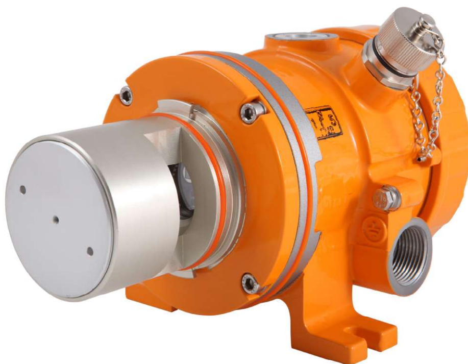
Рисунок 4 - Газоанализатор СГОЭС-М11 (исполнение в корпусе из алюминия), внешний вид