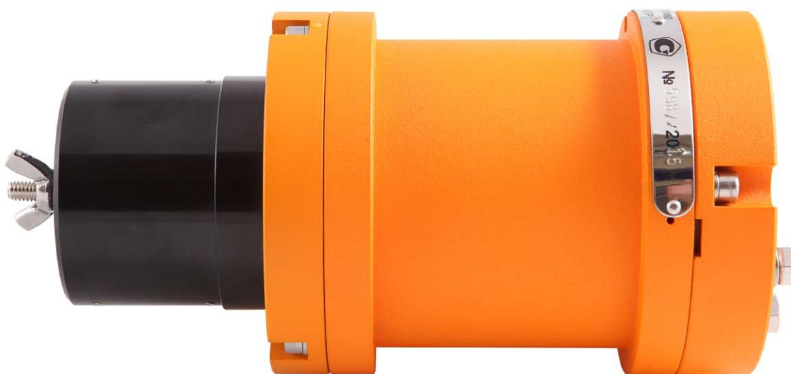
Рисунок 1 - Газоанализатор СГОЭС, внешний вид (без модуля отображения информации и кронштейна)