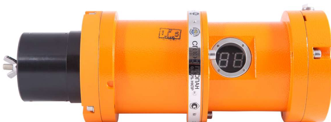
Рисунок 2 - Газоанализатор СГОЭС-внешний с модулем отображения информации