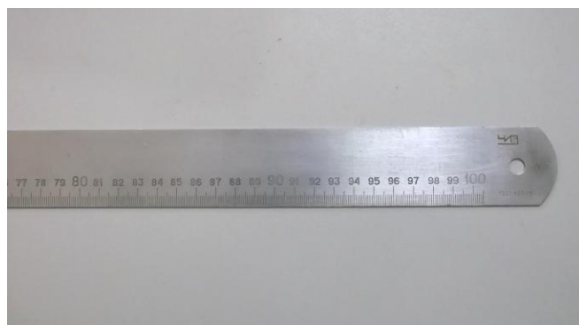
а) линейка с одной шкалой

Внешний вид линейек представлен на рисунке 1.