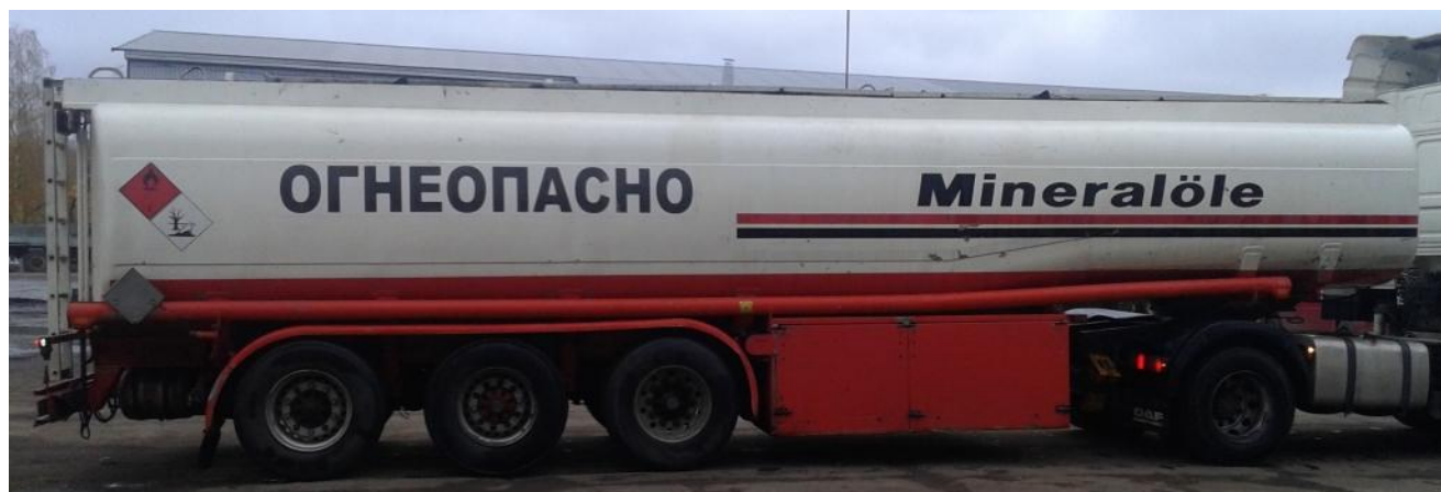
Рисунок 1 - Общий вид полуприцепа-цистерны ESTERER 5298

Схема пломбировки для защиты от несанкционированного изменения положения указателя уровня налива, обозначение места нанесения знака поверки представлены на рисунке 2.