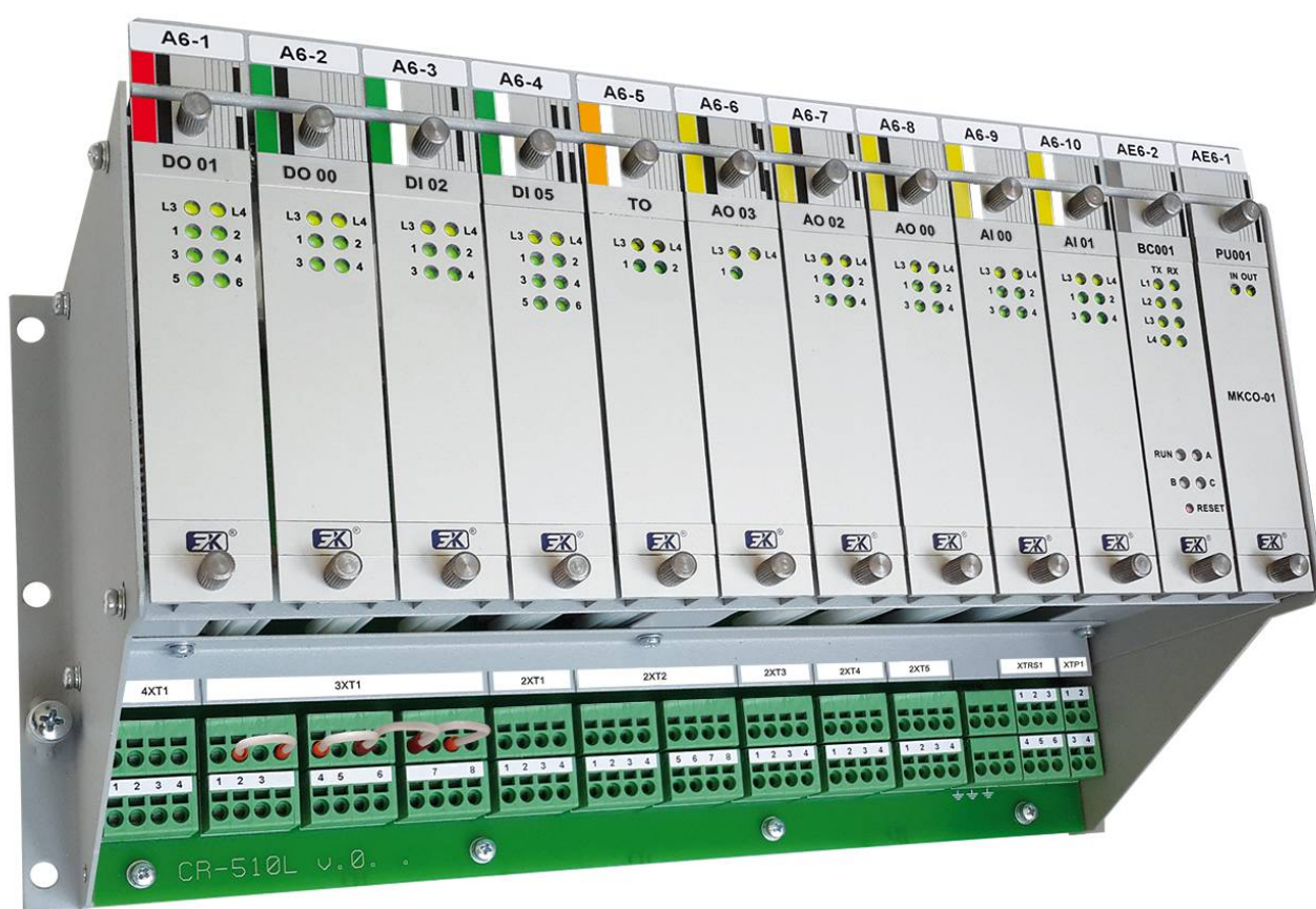
Рисунок 1 - Общий вид контроллера связи с объектом многофункционального МКСО-01

Общие виды контроллеров и модулей ввода-вывода представлены на рисунках 1 и 2 соответственно. Обозначение места нанесения знака поверки в виде наклейки представлено на рисунке 2.