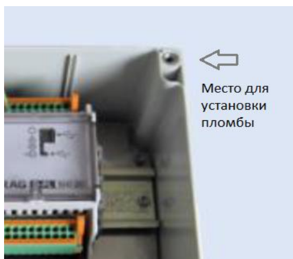
Рисунок 2- Места пломбирования

В целях предотвращения доступа к узлам регулировки и настройки, а также к элементам конструкции, предусмотрены места пломбирования, указанные на рисунке 2.