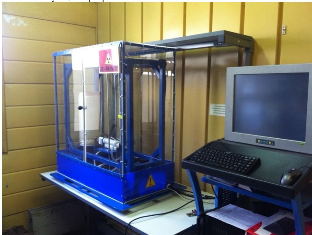
Рисунок 1 - Толщиномеры покрытий специализированные рентгенфлуоресцентные в составе технологического оборудования РТВК-1КР. Общий вид

Принцип действия толщиномера покрытий специализированного рентгенфлуоресцентного в составе технологического оборудования РТВК-1КР основан на измерении спектральных характеристик рентгеновского излучения, возбуждаемого внешним источником - рентгеновской трубкой в материале покрытия или основы, полупроводниковым детектором. Электрический сигнал, величина которого пропорциональна энергии, переданной излучением веществу детектора, регистрируется и анализируется многоканальным амплитудным анализатором с соответствующим программным обеспечением.