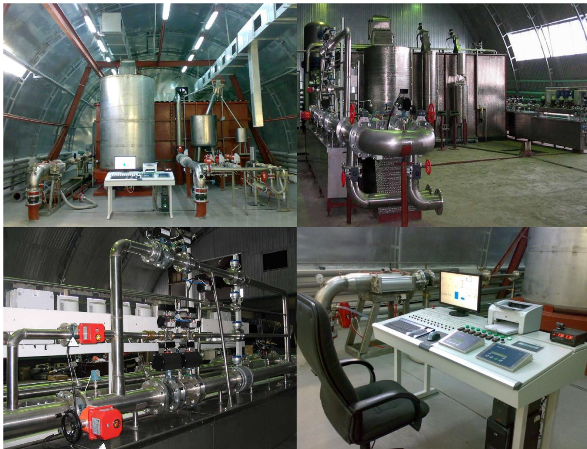
Рисунок 1 – Общий вид установок поверочных автоматизированных УПА

Пломбирование установок поверочных автоматизированных УПА осуществляется с помощью свинцовой (пластмассовой) пломбы и проволоки, которой пломбируется фланцевые соединения расходомеров установки. Средства измерения условий окружающей и измеряемой сред пломбируются в соответствии с описанием типа на конкретное средство измерения. Места пломбирования фланцевых соединений расходомеров установки приведены на рисунке 2.