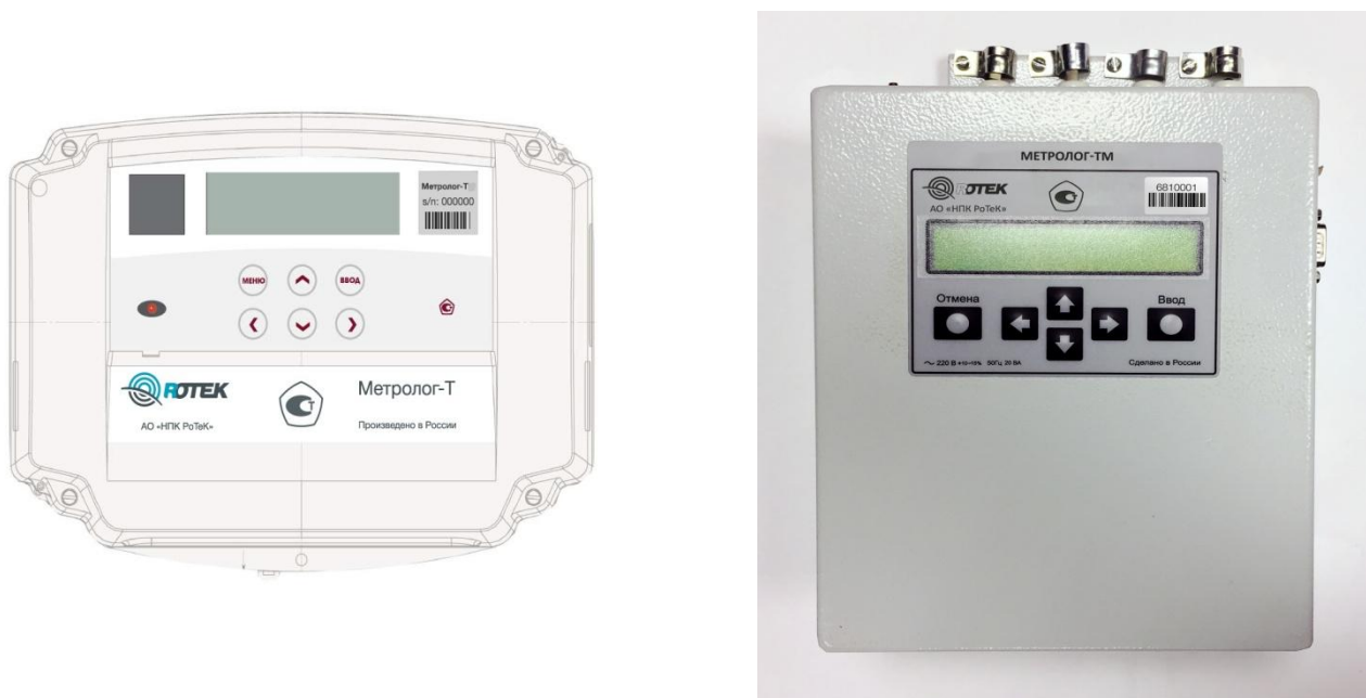
Рисунок 1 - Общий вид средства измерений

По устойчивости к механическим воздействиям вычислители являются вибропрочными и соответствуют исполнению N2 по ГОСТ Р 52931-2008.