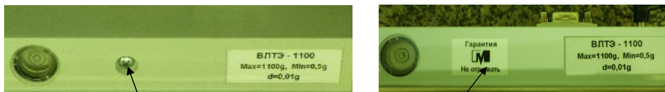
Винт стяжки корпуса

Для защиты весов от несанкционированного доступа, который может привести к искажению результатов измерений, весы пломбируются поверх одного винта стяжки корпуса контрольной этикеткой изготовителя в соответствии со схемой, приведенной на рисунке 2.