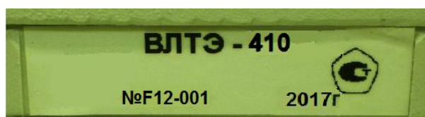
Рисунок 3 - Обозначение места нанесения знака поверки