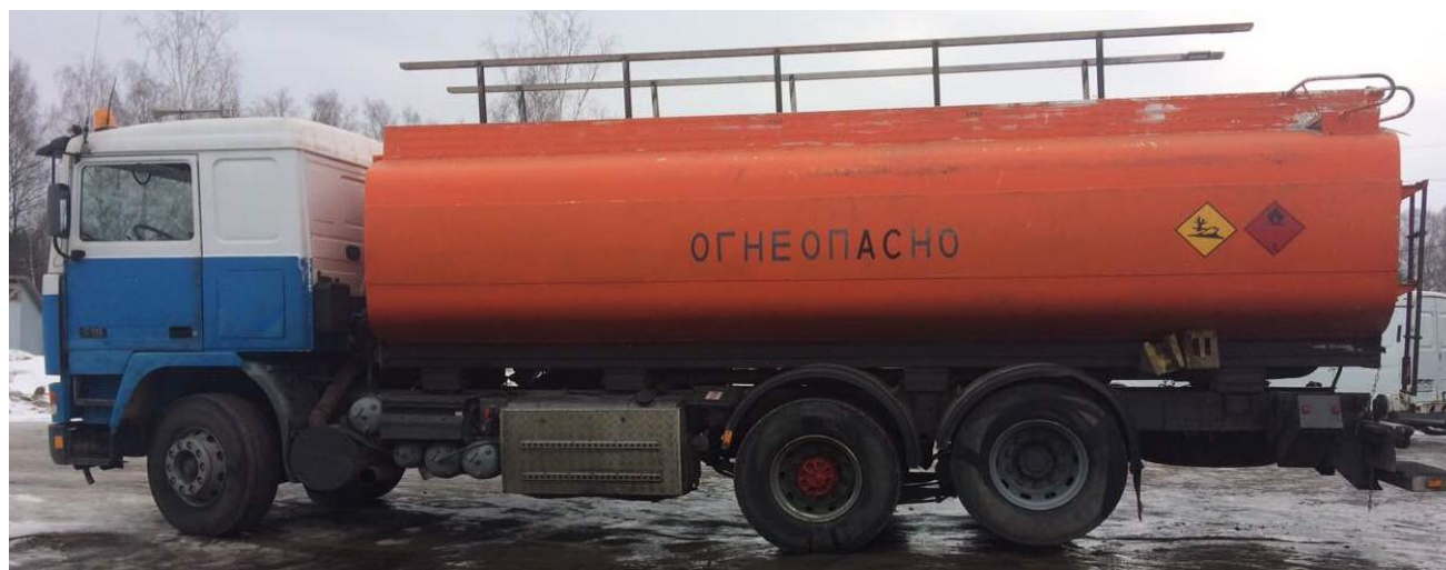
Рисунок 1 - Общий вид автоцистерны VOLVO F16 6X2

Схема пломбировки для защиты от несанкционированного изменения положения указателя уровня налива, обозначение места нанесения знака поверки представлены на рисунке 2.