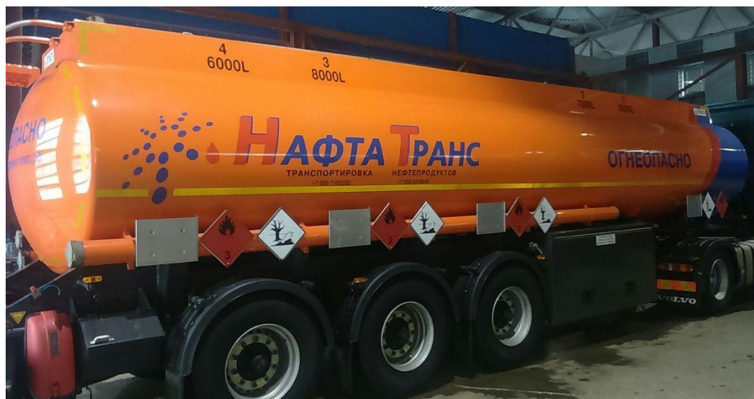
Рисунок 1 - Общий вид полуприцепа-цистерны STOKOTA OPL-38-3/FUE

Схема пломбировки для защиты от несанкционированного изменения положения указателя уровня налива, обозначение места нанесения знака поверки представлены на рисунке 2.