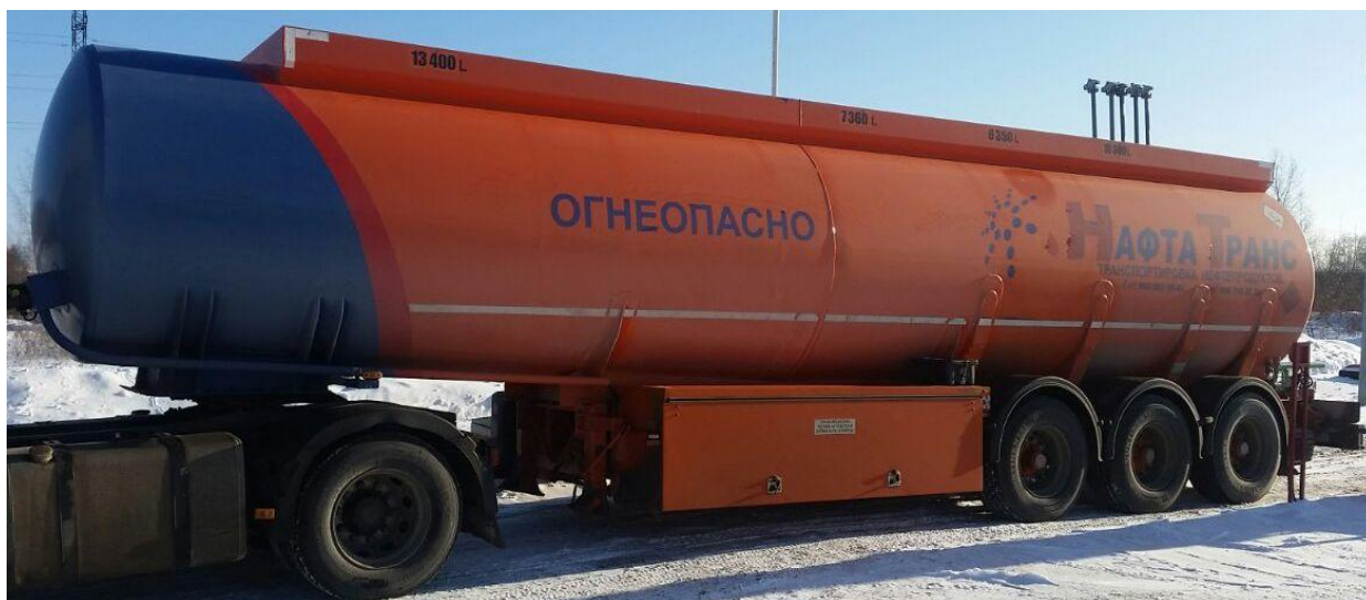
Рисунок 1 - Общий вид полуприцепа-цистерны LAG

Схема пломбировки для защиты от несанкционированного изменения положения указателя уровня налива, обозначение места нанесения знака поверки представлены на рисунке 2.