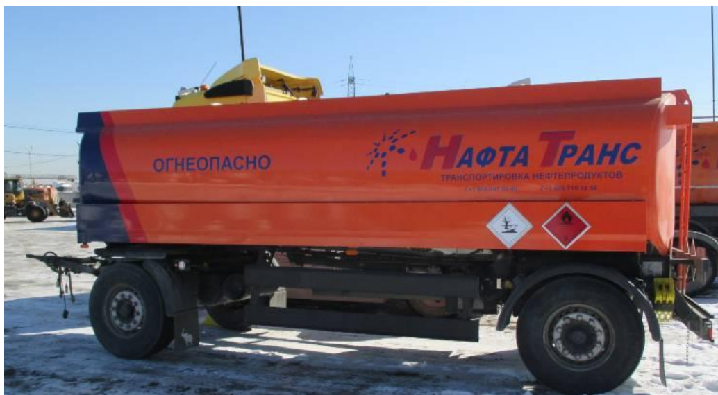
Рисунок 1 - Общий вид прицепа-цистерны ESTERER

Схема пломбировки для защиты от несанкционированного изменения положения указателя уровня налива, обозначение места нанесения знака поверки представлены на рисунке 2.