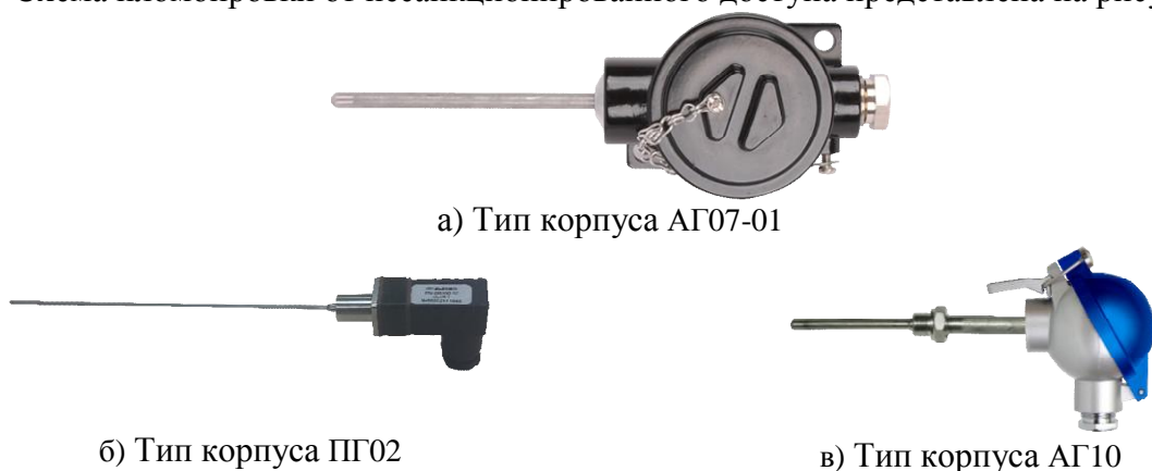
Рисунок 1 - Общий вид термопреобразователей

Схема пломбировки от несанкционированного доступа представлена на рисунке 2.