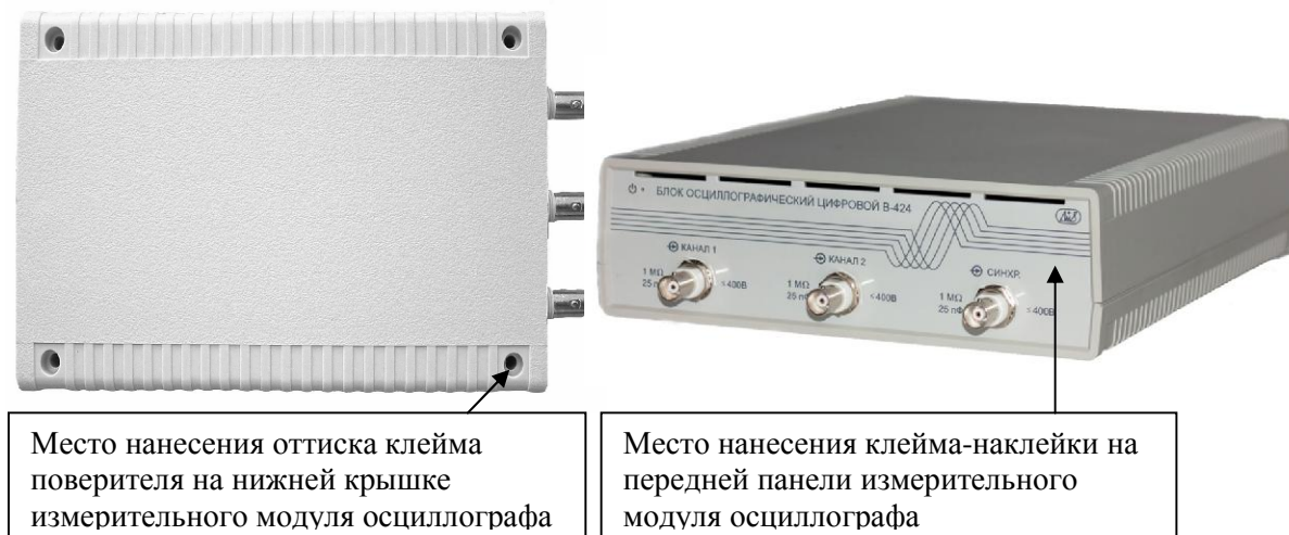
Рисунок 3 - Фотография внешнего вида осциллографов модификаций В-423, В-424