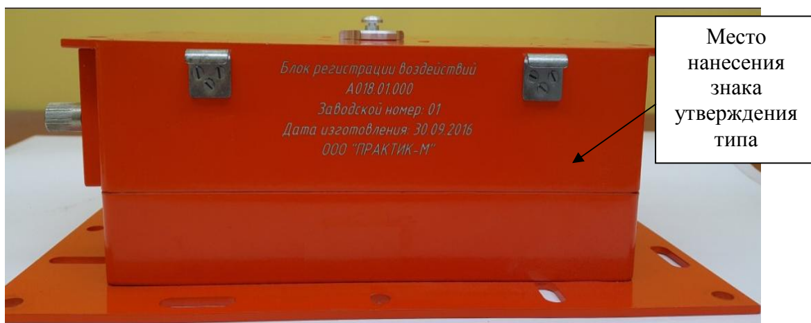
Рисунок 2 – Маркировочная табличка блока регистрации воздействий блока регистрации воздействий А018.01.000, место нанесения знака утверждения типа