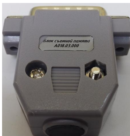
Рисунок 3 – Общий вид блока съемной памяти А018.03.000