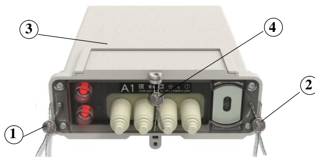
д) счетчики наружной установки