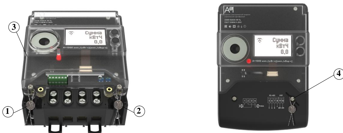
а) счетчики в обычном корпусе

Общий вид и схемы пломбировки счетчиков показаны на рисунке 1.