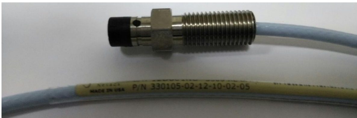
Рисунок 1 - Общий вид первичного преобразователя модификации BN-330105-02-12-10-02-05