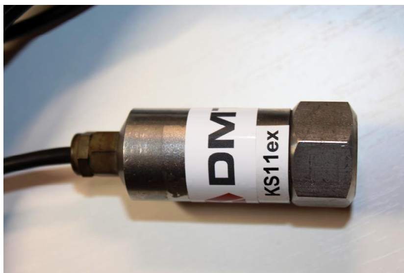
Рисунок 2 - Общий вид первичного преобразователя (акселерометра KS11ex), входящего в состав комплексов программно-аппаратных вибродиагностического мониторинга состояния оборудования «PLANTSAFE-VD NGHM-DMT»