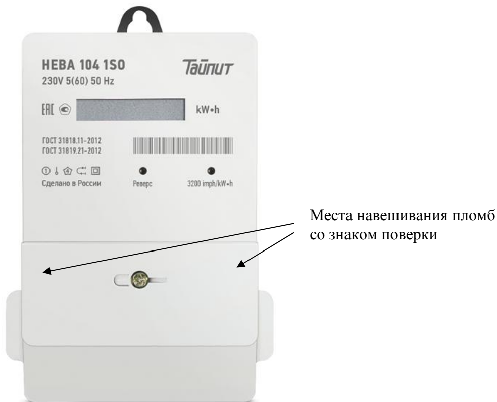
Рисунок 5 - Внешний вид модификации НЕВА 104 с местом опломбирования и местом нанесения знака поверки