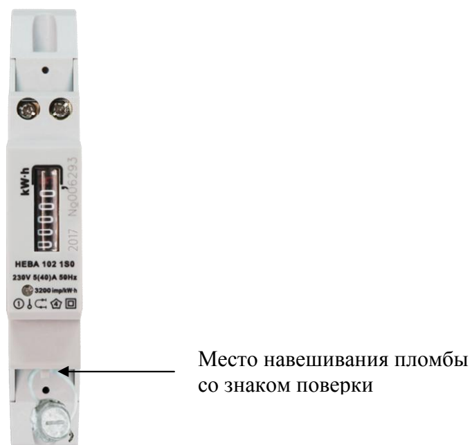
Рисунок 2 - Внешний вид модификации НЕВА 102 с местом опломбирования и местом нанесения знака поверки