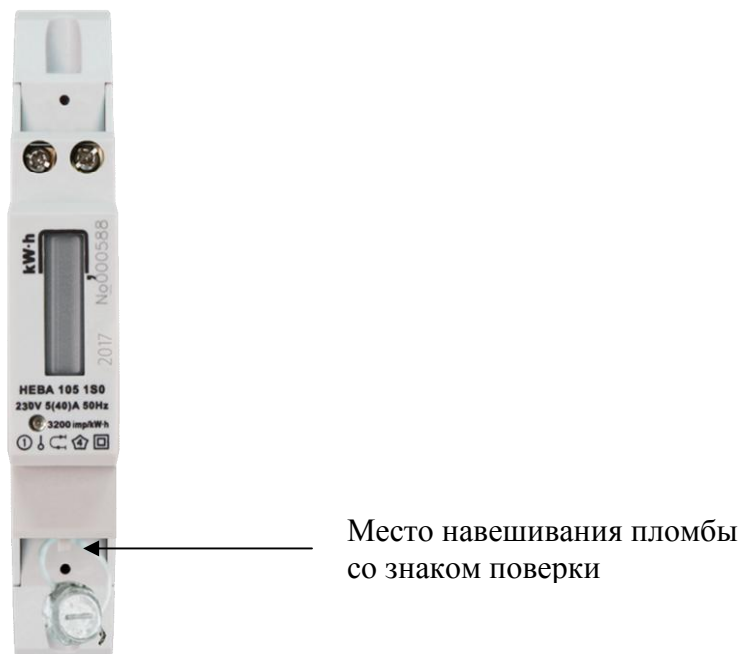
Рисунок 6 - Внешний вид модификации НЕВА 105 с местом опломбирования и местом нанесения знака поверки